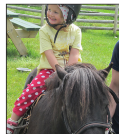
Gøy for barn